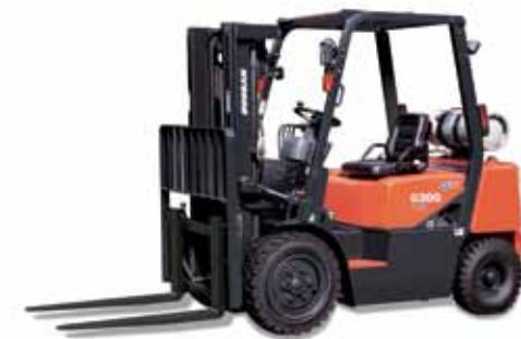
G20G / G25G / G30G 2 000kg 2 500kg 3 000kg LPG, pneumatische banden