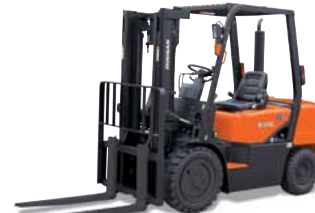
D20G / D25G / D30G 2 000kg 2 500kg 3 000kg Diesel, pneumatische banden